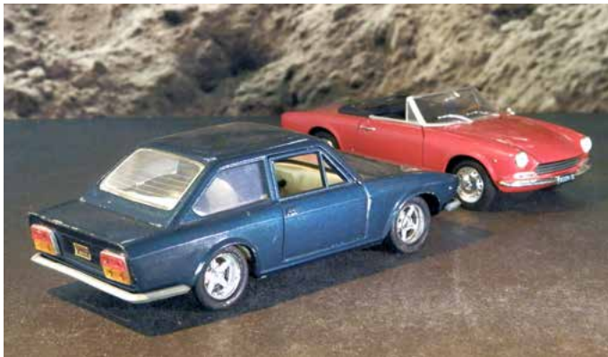
Seat 124 Coupé 1600 van Nacorral uit Spanje en Fiat 124 AS Spider van Metro uit China, 1:24 gietmetaal.