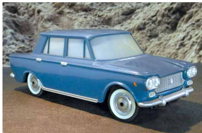
De Fiat 1300 uit 1961. Helaas zijn de ruitjes wat mat geslagen, want er zit ook een interieur in. Motor en wielophanging mooi gedetailleerd.

De kwaliteit was hoog en merkwaardigerwijs werd het complete model in een fraaie doos verkocht als "demon-tage model". In 1957 volgde de Fiat 500, en in 1961 kreeg Pocher zelf van Fiat de opdracht een model van de 1300 te produceren. Deze nieuwe auto werd geïntroduceerd