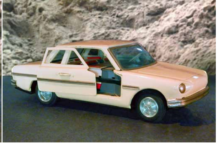
Pininfarina Sigma 1963. Een prototype veiligheidsauto met schuifdeuren. Blikken model ongeveer 1:15 uit het verre oosten als speelgoed.