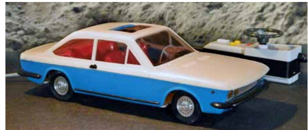
124 Coupé als speelgoed met kabelbediening. Deze is er ook in oranje/wit. Ongeveer 1:16.

of op Ebay. Pocher is al jaren in handen van het Engelse Hornby, en produceert ook nog steeds bouwdozen op schaal 1:8 van veel modernere supercars.