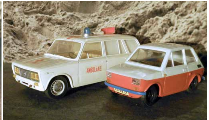
Van RICO uit Spanje deze 125 Ambulance. Helaas wat incompleet, mist de voorbumper en achterklep. En 126 van onbekend fabrikaat, Beide modellen ± 1:13.