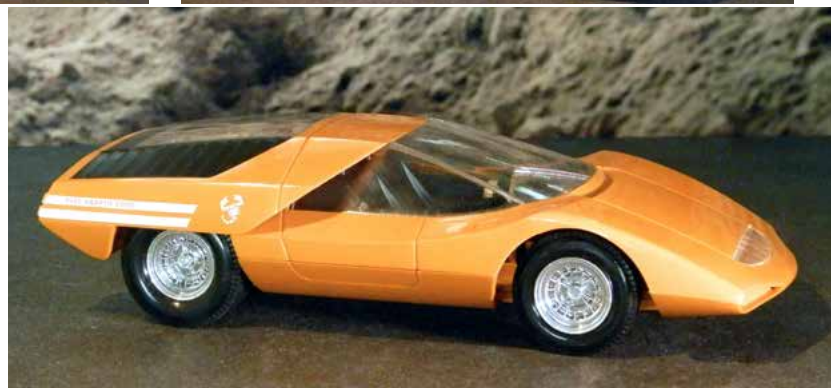
Pininfarina prototype Fiat Abarth 2000. Plastic model van Meccano Triang uit Frankrijk, ± 1:18.

Ook laat ik enkele andere modellen zien, niet van Pocher maar van andere producenten, ook op de grote schaal van 1:13, die denk ik nogal zeldzaam zijn zoals de oranje 127 en de grote Fiat Dino Coupe. Deze laatste heeft geen