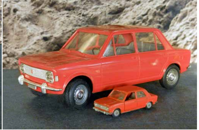
Vershil moet er zijn. 1:13 van Pocher en 1:43. Ik had deze ook op ware grootte in mijn jonge jaren.

op de Autoshow van Turijn in april dat jaar. Pocher kreeg onder grote geheimhouding de constructie plannen van de auto, bezegeld met notariële akten. Het model was punctueel op tijd klaar en veroorzaakte veel opwinding. Het was een fors kunststof model op schaal 1:13, werd geleverd in een prachtige doos, met werkende stuurinrichting, de motorkap kon open en liet de motor zien en het stond op mooie rubber banden.