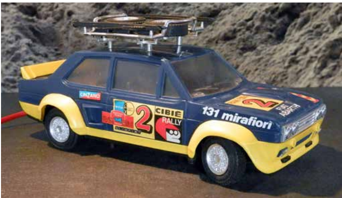
131 Abarth Rally met kabelbesturing. Ook een fors model 1:13 maar van onbekend fabrikaat (Pocher?). Er staat wel Made in Italy onderop.