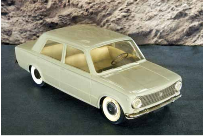
Pocher 124 Berline